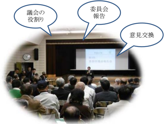
過去の議会報告会のようす